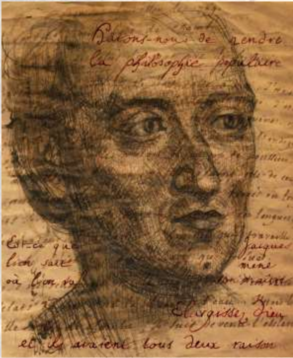
"Esprit de Diderot" par Béatrice Turquand d'Auzay, d'après un portrait de Mme Therbouche (1767), 2013 (© Turquand d'Auzay)